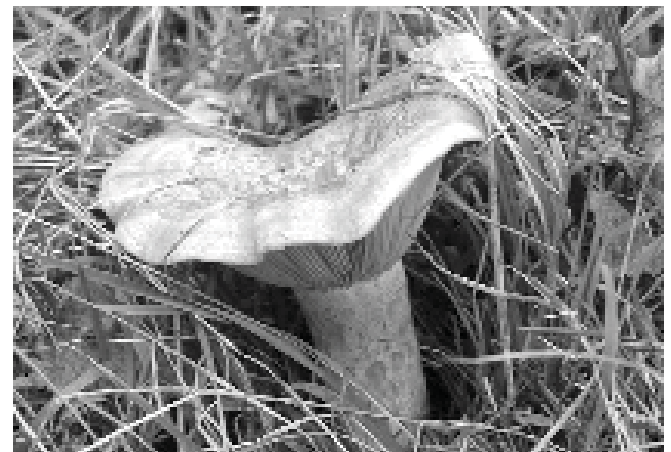
Şekil 1. Çintar (=melki, çam mantarı, kanlıca) olarak bilinen Lactarius deliciosus 'un görünümü. [29]

Çalışmamızda 01.01.2006-31.12.2006 tarihleri arasında Pamukkale Üniversitesi Tıp Fakültesi Acil Tıp Anabilim Dalı'na ve Denizli Devlet Hastanesi Acil Servisi'ne mantar zehirlenmesi ile başvuran ve mantar zehirlenmesi tanısı alan tüm hastalar geriye dönük kesitsel olarak incelendi. Dosyalar bilgi işlem merkezlerindeki ICD-10 tanı kodlama sistemindeki "T-62.0 = mantar yemenin zehirli etkisi" kodundan ve Sağlık Müdürlüğü'ne gönderilen "gıda zehirlenmeleri vaka bildirim fişlerinden" tarandı. Semptomların başlama süresiyle prognoz arasındaki ilişki değerlendirildi. Hastaların yaşı, cinsiyetleri, başvuru tarihi, şikayetleri, şikayetlerin başlama süreleri, ailede başka zehirlenme olup-olmadığı, klinik ve laboratuvar bulguları [tam kan sayımı, KCFT (karaciğer fonksiyon testleri), (AST, ALT, Bil, vb), BFT (BUN, Cre), elektrolitler (Na, K, Cl vb.)], tedavi yaklaşımları, sonuçlar (acilden taburcu, sevk, tedaviyi red, servise-yoğun bakıma yatış, ölüm) değerlendirildi. İstatistiksel yöntem olarak ki-kare ve ANOVA testleri kullanıldı. Sonuçlar frekans dağılımı ve ortalama ( \pm SD) olarak verildi. Dosya verileri eksik olanlar ve dosyalarına ulaşılamayan hastalar çalışma dışı bırakıldı.